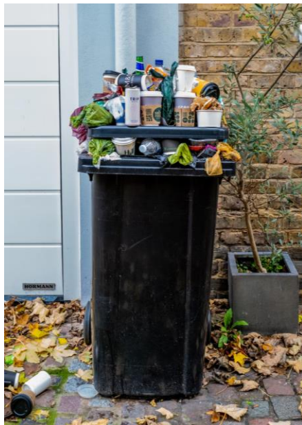
GESTÃO DO LIXO