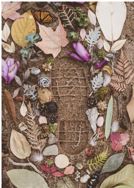
PEGADA DE CARBONO

EM QUE QUEREMOS APOSTAR COM A NOSSA POLÍTICA DE SUSTENTABILIDADE